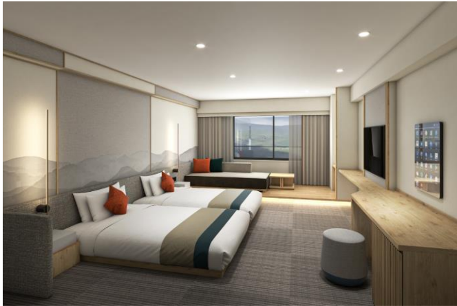
和洋室ツインルーム

窓からは雄大な景色が望め、陽の光がさしこむ明るい客室です。部屋の内装や照明は落ち着いたトーンにし、くつろげる空間に。幅広いベッドでゆっくり休める洋室ツインルーム、ベッドのほかに和室がついた和洋室タイプのお部屋を数多く揃えているほか、スイートルームやファミリールームなど、大人数で快適に過ごせる広さの部屋も充実しています。