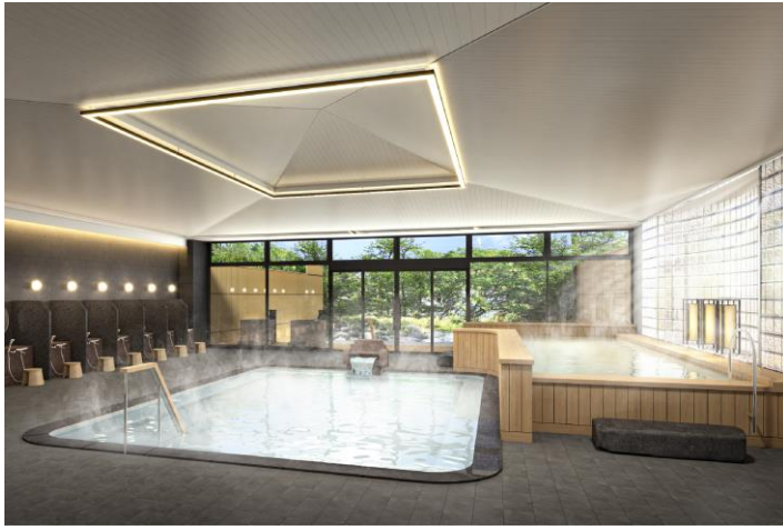
湯量たっぷりの大浴場