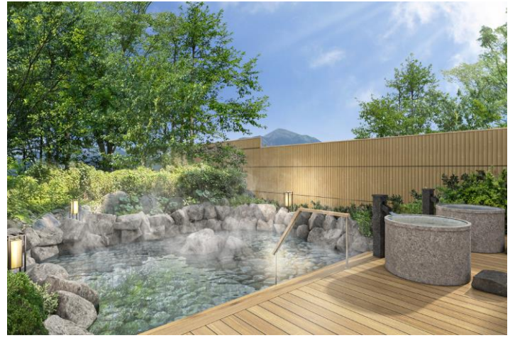
源泉かけ流し露天風呂