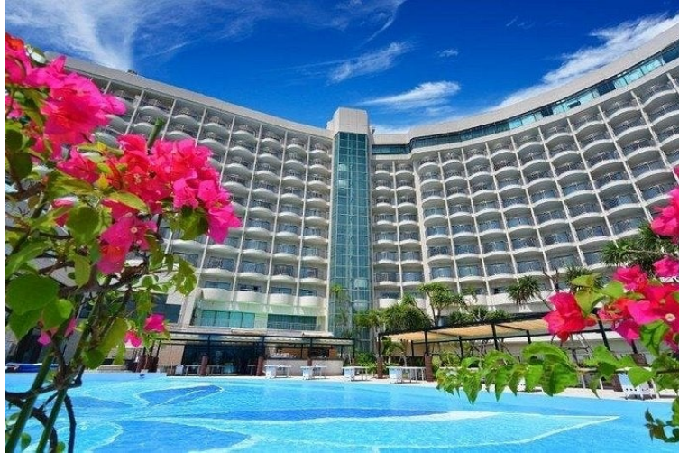
ロワジールホテル 那覇