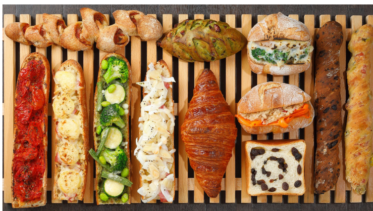
ブレ・ド・オール 商品一例