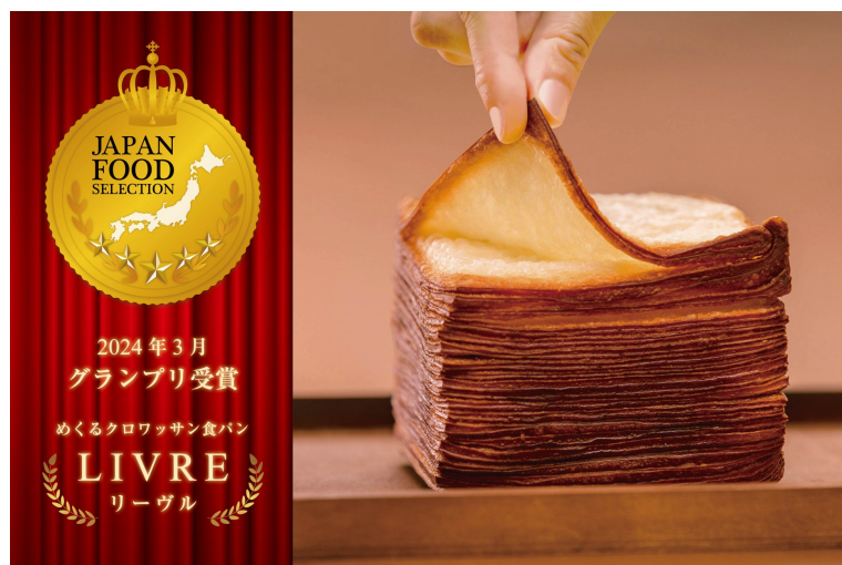
ジャパンフードセレクショングランプリ受賞 2024年3月