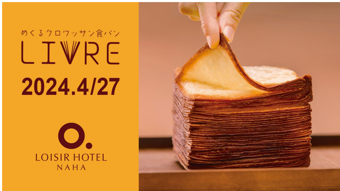
めくるクロワッサン食パン リーヴル ロワジールホテル 那覇で4月27日より発売

ジャパン・フード・セレクションで最高評価のグランプリを受賞した、未だ行列の絶えない話題のヒット商品「めくるクロワッサン食パン リーヴル」がロワジールホテル 那覇「西町のパン屋 ブレ・ド・オール」のリニューアルオープンに合わせて発売決定。グループホテルの「ロイヤルパインズホテル浦和」以外で購入できる唯一のショップです。