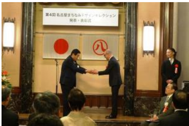
2019年3月27日、名古屋市役所本庁舎で行われた「第4回名古屋まちなみデザインセレクション」発表・授賞式