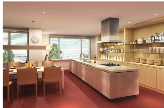
スペシャルルーム(キッチンランカー)