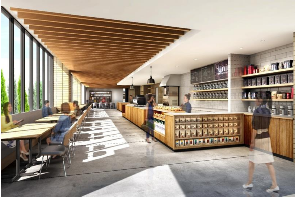
ユニール 赤坂店イメージ (ホテル1階)