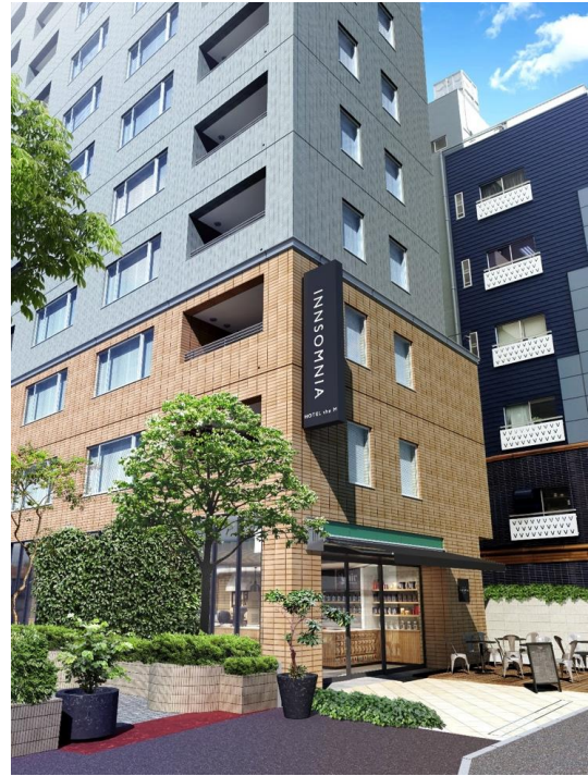
INNSOMNIA akasaka 外観イメージ