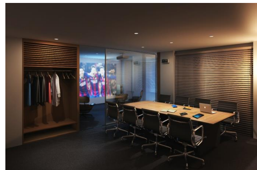
スペシャルルーム(ワーカホリック)