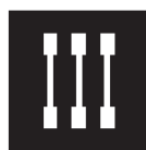
綿棒 Cotton buds