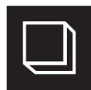
ボディウォッシュ Body wash