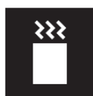
煎茶スティック Sencha sticks