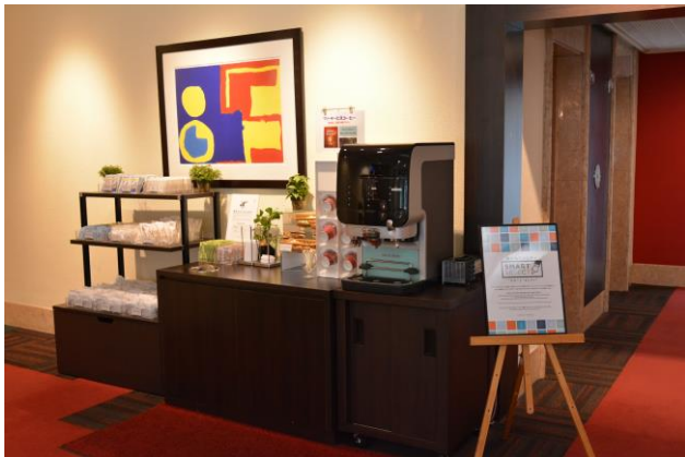
チサン ホテル 浜松町の「スマート・セレクトアメニティステーション」