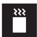
煎茶スティック Sencha sticks