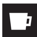
ドリップコーヒー Drip coffee