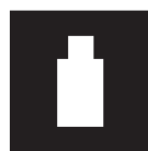
クレンジングローション Cleansing lotion