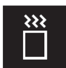
梅昆布茶スティック Ume kombucha sticks