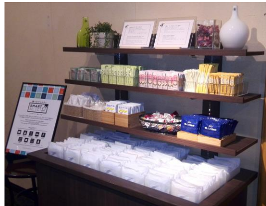
チサン ホテル 神戸のディスプレイ例