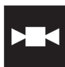
小菓子 Light snacks