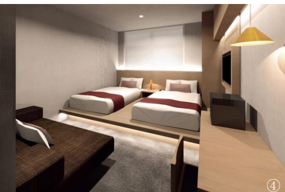
① ホテル正面玄関 ②1F共用部 ③スーペリアツインルーム ④ツインルーム ※すべてイメージ