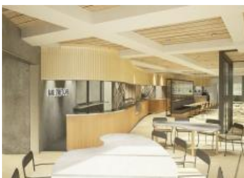
(写真左) ホテルレセプション (写真右) 飲食店 (写真左下) 飲食店 (写真右下) 客室(ツインルーム)