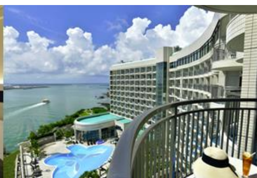
客室バルコニーからの願望