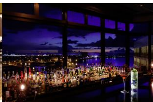
バー プラネットカウンター