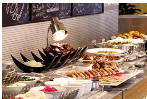
オールデイダイニング フォンテーヌ料理イメージ