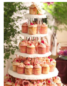
カップケーキイメージ