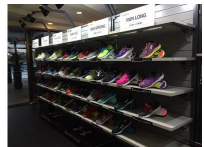
最新ランニングギア(イメージ)