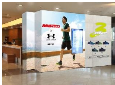
ロワジールホテル 那覇 1F ロビーエントランス (イメージ)

ロワジールホテル 那覇では、スポーツアイランド沖縄へ訪れる方々に対し、これからもスポーツを通じて有効な情報とサービスを提供していく予定です。